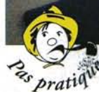
Le bateau présenté n'offrirait aucun rangement !