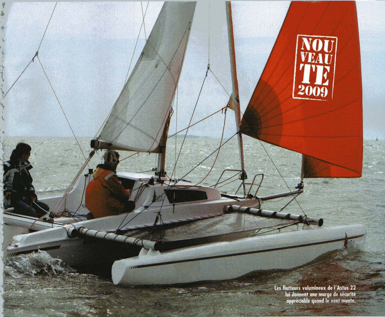
Les flotteurs volumineux de l'Astus 22 lui donnent une marge de sécurité appréciable quand le vent monte.