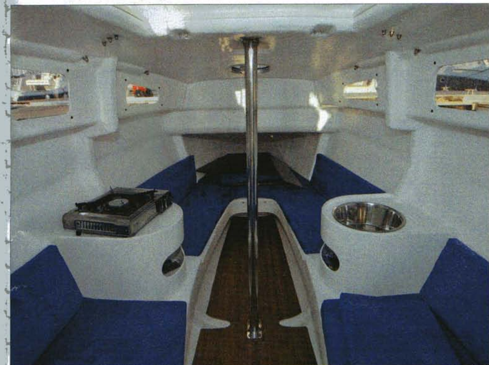
Les emménagements intérieurs sont simples mais autoriseront la petite croisière avec l'ajout prévu de quelques équipets. Les deux puits de dérive sont invisibles, cachés sous les banquettes.