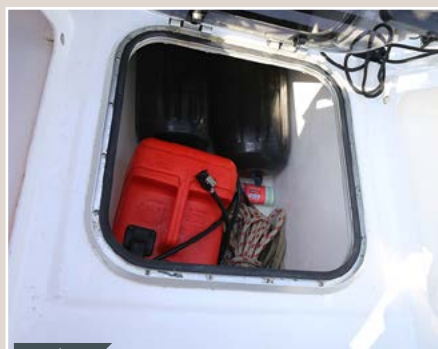
Pratique Le grand coffre situé à l'arrière du cockpit permet de loger la nourrice, les aussières ou les pare-battage.