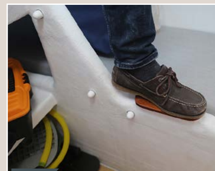
Pratique Bien vue la petite marche en bois sur le haut du puits de dérive pour s'assurer une descente sans heurt.