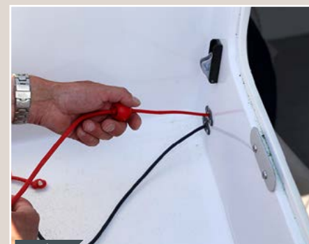
Pratique Le système de relevage de la dérive est très simple avec ce blocage des bouts sur un taquet sifflet.