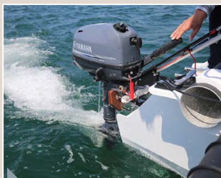
Pas pratique La chaise moteur trop haute oblige à garder du poids sur l'arrière. Le chantier s'emploie à rectifier le tir...