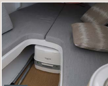
Pratique Le bloc WC chimique est amovible. Il vient se caler en toute discrétion sous la grande couchette avant.