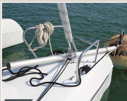
Pratique La présence d'un véritable balcon avant est un gage de sécurité pour assurer les déplacements à l'étrave.